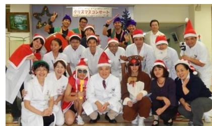
病院長と緩和ケアチームメンバーとエイサー隊