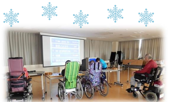
↑ 新病棟にて余暇活動 (カラオケ)